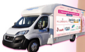
CareReady Mobile Diagnostic