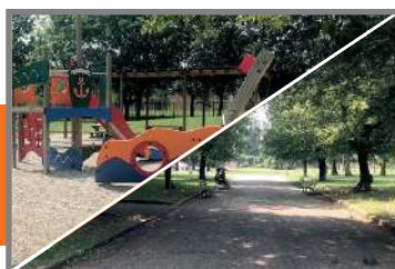
Lavori Pubblici: diversi gli interventi previsti in Città a pag. 11