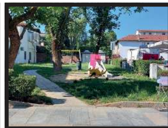
ALCUNE IMMAGINI DEI LAVORI DI MANUTENZIONE STRAORDINARIA